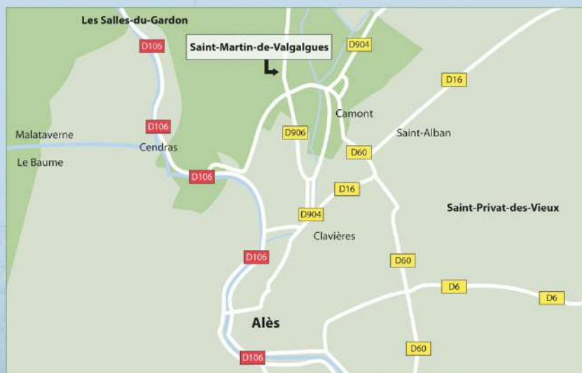
Situé à 5 minutes d'Alès et à 30 minutes de Nîmes.